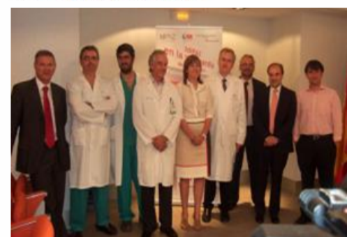
Ante la prensa contando las novedades (archivo)

Además, han señalado que "comenzarán a comercializarse en aproximadamente en un año y medio y han sido las primeras patentes que licencia la Unidad de Innovación del Instituto de Investigación Biomédica IdiPAZ".