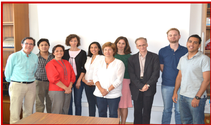
Equipo de investigación en el área de Epidemiología Cardiovascular y Nutrición.

E l grupo de Epidemiología Cardiovascular y Nutrición estudia la historia natural de la enfermedad cardiovascular mediante investigaciones tanto de base poblacional como en la clínica. El grupo lleva a cabo proyectos propios y numerosa investigación colaborativa. Entre los proyectos propios se encuentra una cohorte de 4.000 ancianos de base poblacional establecida en el año 2000 y seguida hasta la actualidad. Entre otras contribuciones al conocimiento de la salud de los ancianos, esta cohorte ha permitido establecer el impacto nocivo