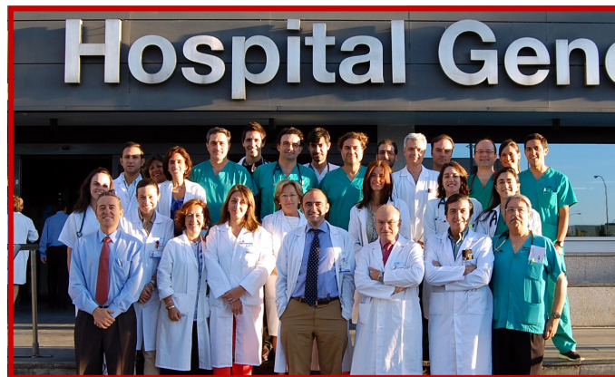
Parte del equipo de investigación en el área de Cardiología.

Como grupo consolidado ICCI-PAZ presenta una producción científica muy abundante con un Factor Impacto superior a los 300 puntos, actividad que se ha mantenido o incrementado a lo largo de los cinco últimos años.